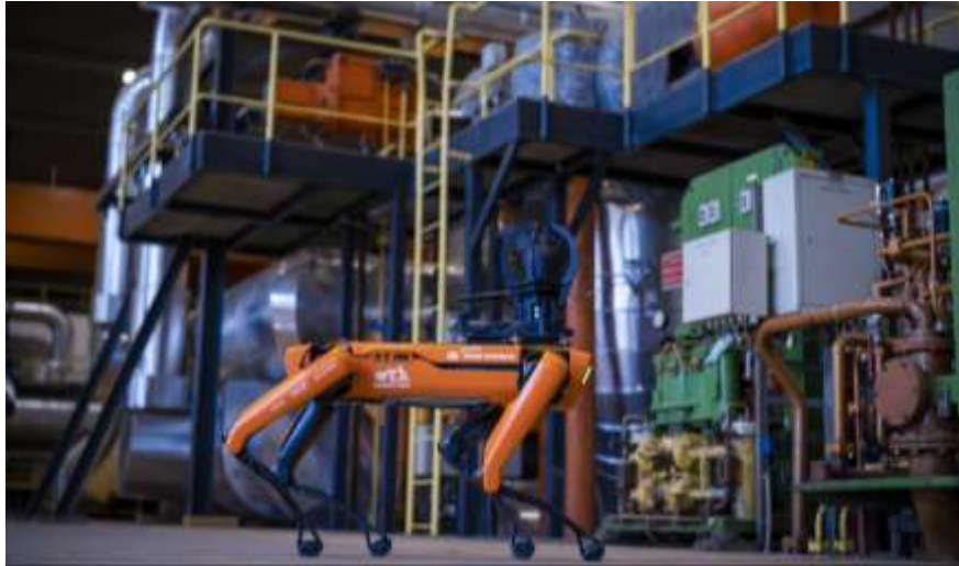
Boston Dynamics - Spot (USA)